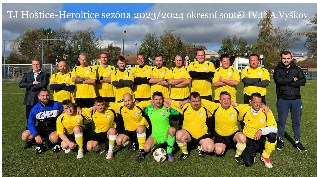
TJ Hoštice-Heroltice sezóna 2023/2024 okresní soutěž IV.tř.A.Vyškov