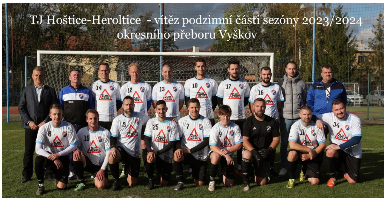
TJ Hoštice-Heroltice - vítěz podzimní části sezóny 2023/2024 okresního přeboru Vyškov